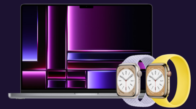
1등 맥북 프로 16 2등 맥북 에어 15 3등 애플워치 8